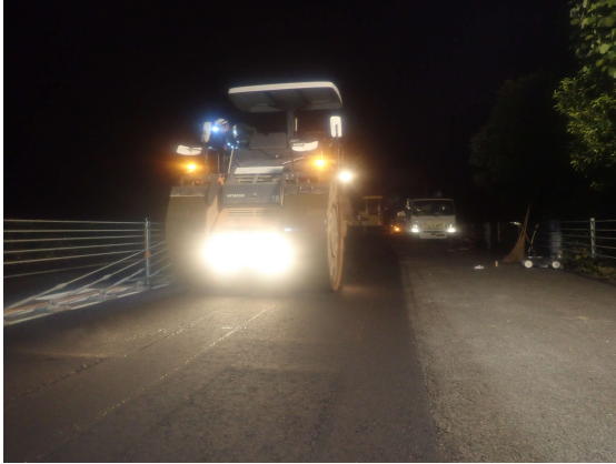
<舗装補修工事・4車線化工事>